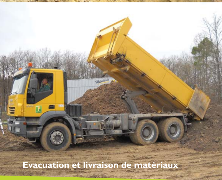
Evacuation et livraison de matériaux