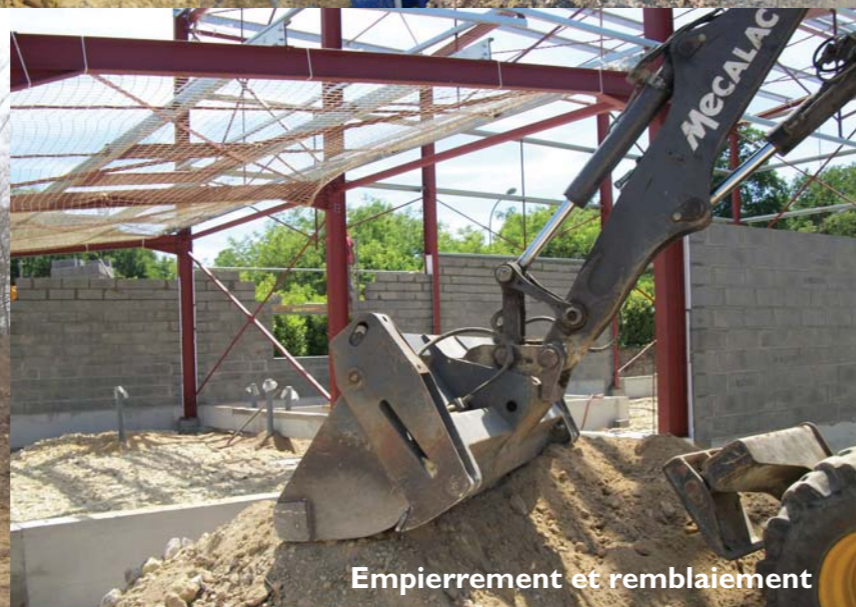
Empierrement et remblaiement