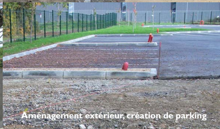
Aménagement extérieur, création de parking