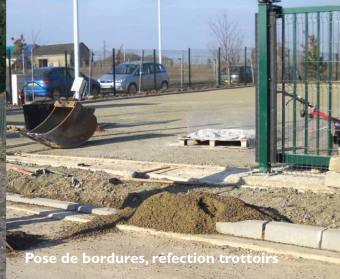
Pose de bordures, réfection trottoirs