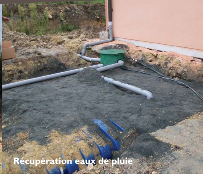
Récupération eaux de pluie